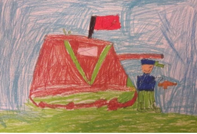
SÜMEYRA NART (1-F)

Şehidim ruhun göklerde nöbette, kanın al bayrakla en yükseklerde.