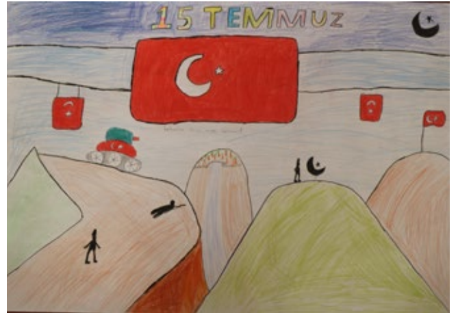
AZRA ACAR (4-B)

Vatan için katlanılan ölüm kadar, tatlı ve şerefli bir ölüm var mıdır?