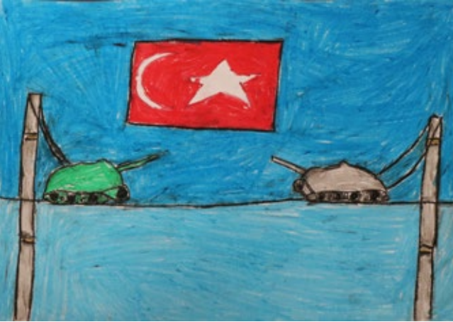
ELA NUR YİĞİT (3-C)