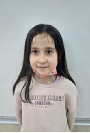
Hira HUNİLİ 2/F

Ay yıldızlı bayrakla Göğsündeki imanla Dimdik durarak düşmana Dünyaya bir ders verdiler Korkusuz kahramanlar. Bayraklar ellerinde Tekbirler dillerinde Allah, vatan uğruna Şehit, gazi oldular Korkusuz kahramanlar.