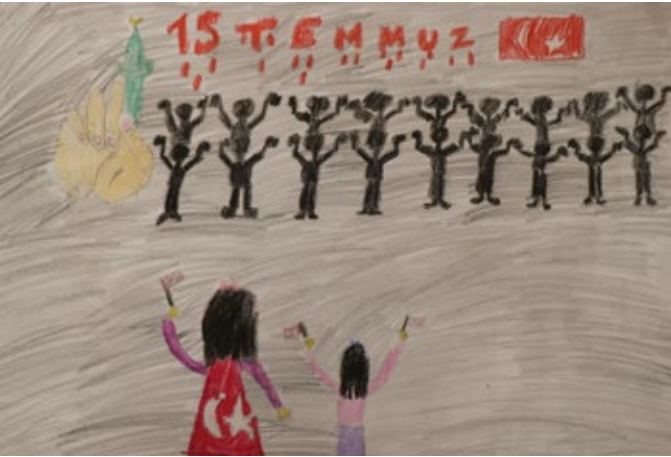
SUDE YEŞİLBAŞ (3-A)

Bir Hilal uğruna ya Rab ne güneşler batıyor.