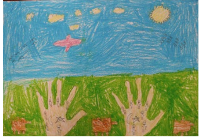
ELİF ECE BAYSAL (2-C)

Şehidim ruhun göklerde nöbette, kanın al bayrakla en yükseklerde.