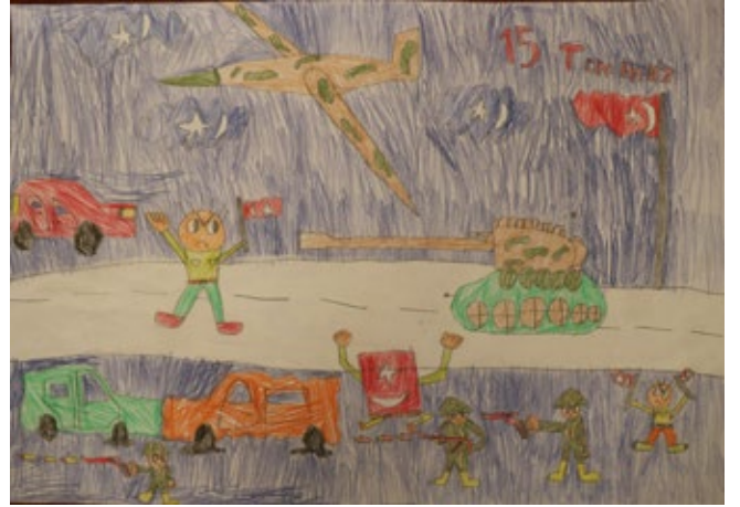
AHMET ENES DURUKAN (2-F)

Bayrakları bayrak yapan üstündeki kandır Toprak, eğer uğruna ölen varsa vatandır.