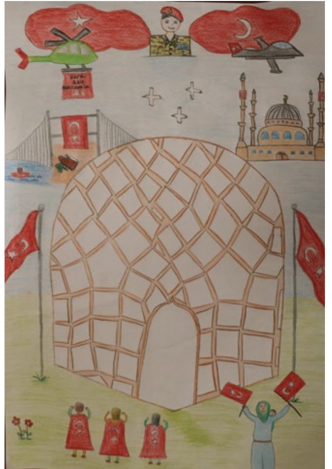
TUĞBA SENEM DEMİRCİOĞLU (4-A)