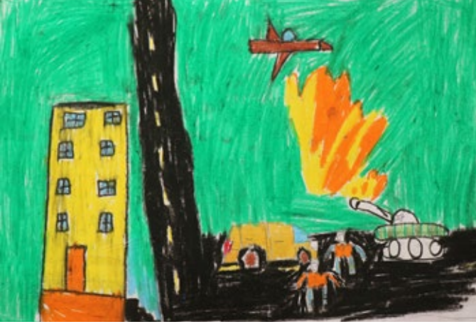
ABDÜLHANİ ÜNALAN (3-B)

VATAN için yaşayıp öldünüz; siz toprağa değil, kalplere gömüldünüz.